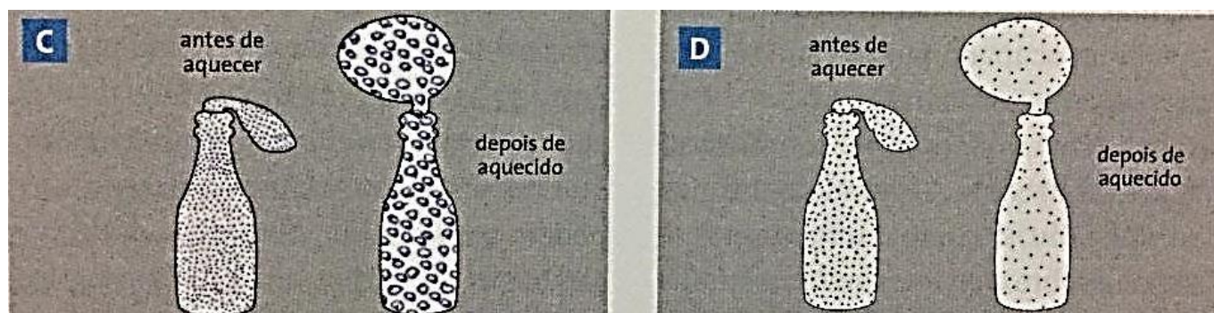
Figura do livro Construindo Consciências: 9º ano: Ensino Fundamental . São Paulo: Scipione, 2009. p. 63.

38. Dois estudantes representaram modelos diferentes para o ar em duas situações. Observe o esquema a seguir: